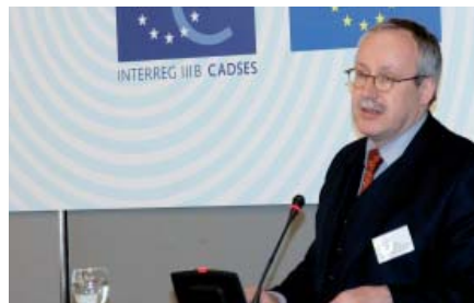
Tilo Braune, Staatssekretär im Bundesministerium für Verkehr, Bau- und Wohnungswesen

- ein klares Leitbild und politisch verbindliche Leitlinien und Konzepte der Stadtentwicklung, die längerfristige Planungssicherheit für Investoren geben,